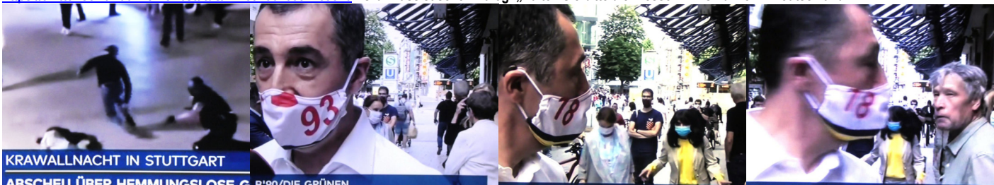
KRAWALLNACHT IN STUTT GART